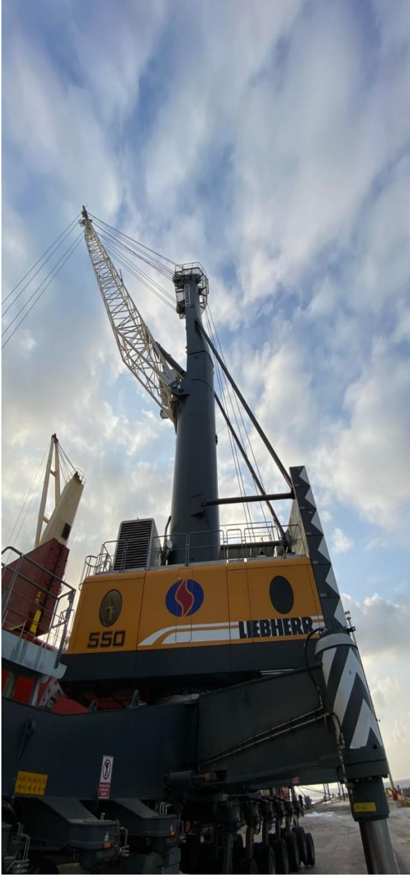
LIEBHERR LHM 550