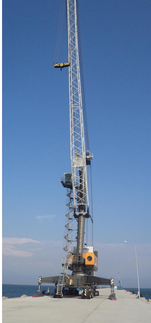
LIEBHERR LHM 420